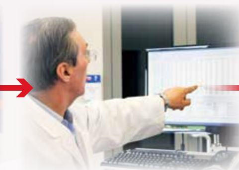
Ważna jest stała kontrola. Nieprawidłowości od razu widać na monitorze komputera