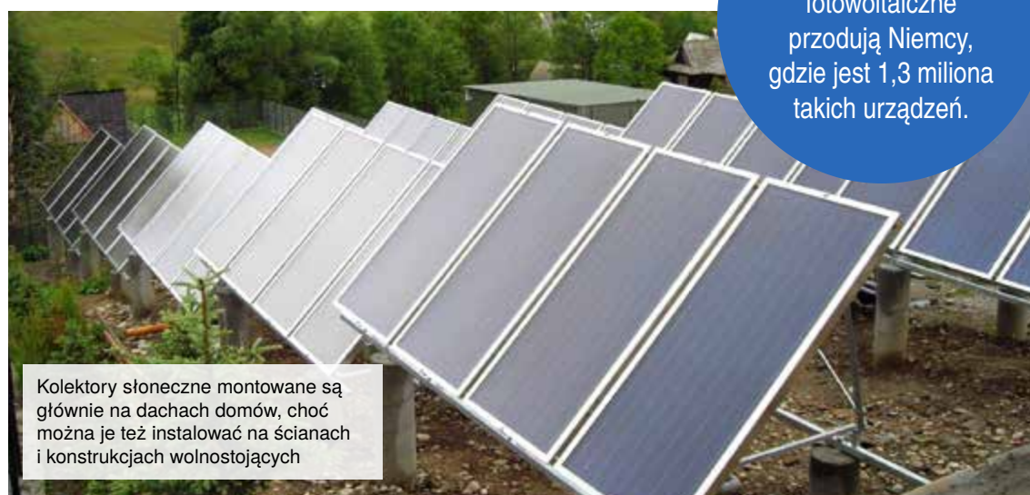
Kolektory słoneczne montowane są głównie na dachach domów, choć można je też instalować na ścianach i konstrukcjach wolnostojących

kwartalu 2014 roku moc zainstalowana w systemach fotowoltaicznych w Polsce wyniosła 6,6 MWp. W kolejnych miesiącach nastąpił jednak duży wzrost na rynku, a jedynie w pierwszych miesiącach roku 2015 zainstalowano 9 MWp, co w chwili obecnej łącznie daje niemal 40 MWp zainstalowanej mocy - stwierdza. Co powinno cieszyć klientów, zjawisku towarzyszy stabilny spadek cen. - Równocześnie dokonuje się nieustanny postęp technologiczny, wzrasta sprawność paneli i ich parametrów, co wpływa na wydajność instalacji. Wszystkie