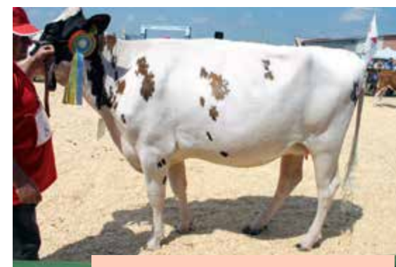
Jałowica PL005247649838 Gonda (nr kat. 89) ojciec: Baxton matka: Gonda, krowa w I laktacji właściciel: OHZ Głogówek sp. z o.o.

Tytuł Superczempiona na Śląskiej Wystawie Bydła Hodowlanego w Kamieniu Śląskim w dniu 13 czerwca 2015 roku zdobyły: