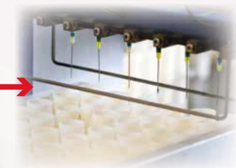
Uzupełnianie czystych próbek konserwantem