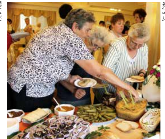
Pysznosci na stoisku „HotBloga” cieszyły się ogromnym zainteresowaniem