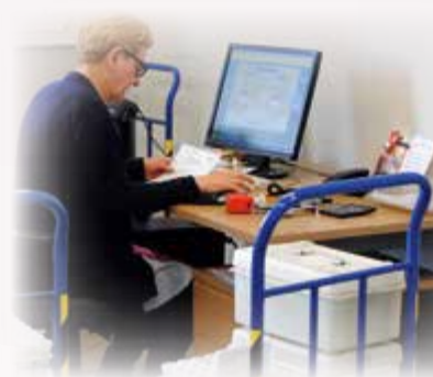
Przyjęcie próbek do laboratorium i wprowadzenie do systemu