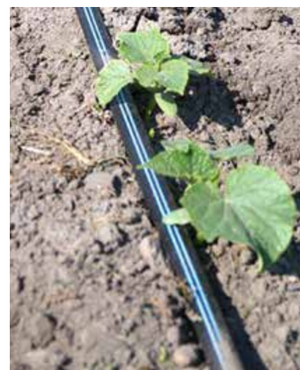
Stosując taśmę kroplującą unikamy polewania liści ogórków