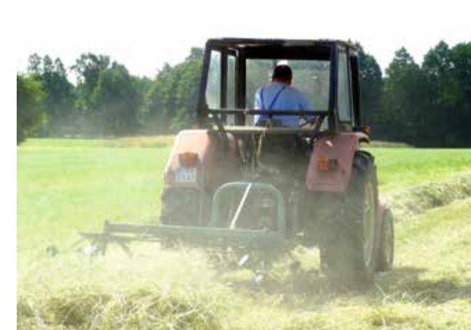
Mniejsze zbiory były także przy pierwszych sianokosach