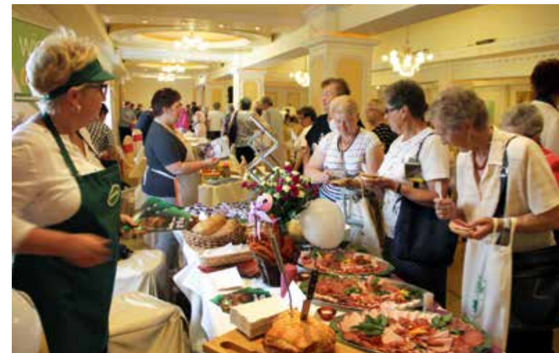
Prezentacja wyrobów firmy „Dworecki” z Golejewa