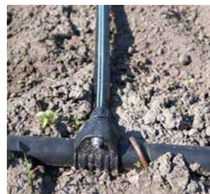
Połączenie taśmy z rurą PE za pomocą obejmy i specjalnego przelotu