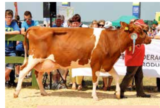
krowa PL005272328654 Sonntag (nr kat. 139) II laktacja ojciec: Ditmar ojciec matki: Classic wydajność w I laktacji: 10.713 kg mleka 379 g tłuszczu, zawartość tłuszczu: 3,53% 324 g białka, zawartość białka 3,02% właściciel: OHZ Głogówek sp. z o.o.

Zestawienie zwierząt, którym przyznano czempionaty