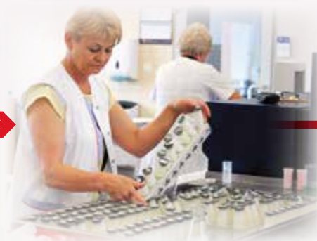
Przygotowanie do badania