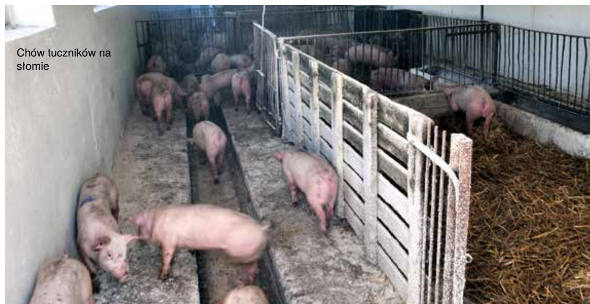
Chów tuczników na słomie

szym, jako produkt odpadowy, otrzymuje się obornik, w drugim gnojowicę. Chów tuczników na głębokiej ściółce (zdecydowanie rzadziej na płytce) zapewnia zwierzętom komfort. Mówi się, że mogą one dodatkowo uzupełniać dawkę pokarmową we włókno przez podjadanie słomy. Jak wiadomo, jest to bardzo ważny czynnik żywienia trzody, który zmniejsza skłonność do kanibalizmu. Z drugiej strony - pasza, którą podaje się tuczni- kom, jest skonstruowana tak, aby zaspokajać potrzeby danej grupy żywieniowej. Ilość włókna jest więc wystarczająca i zwierzęta nie muszą pobierać dodatkowo ze ściółki. Trzeba pamiętać,