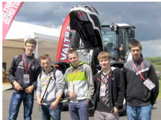
Valtra T - znakomite tło dla zdjęcia z przyjaciółmi

Na drugim stanowisku uczestników czekała jazda terenowa (ruszanie na wzniesieniu bez używania hamulca postojowego), drugą atrakcją tego stanowiska była jazda ciągnikiem wyposażonym w system TwinTrack (system jazdy tyłem) ułatwiający prace polowe oraz leśne. Trzeci stanowisko umożliwiało prezentację pracy ciągnika