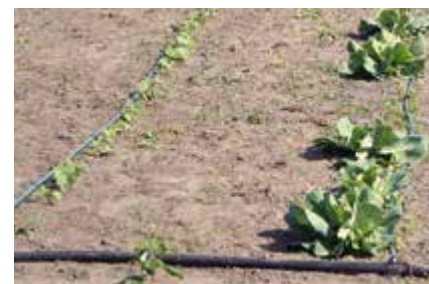
Nawadnianie kroplowe w ogórkach i kapuście, każdy z rzędów ma 80 m długości

Przykład: Zakładamy nawadnianie kroplowe pod ogórki na polu za domem. Obszar ma około 600 m 2 . Nie mamy studni, więc system podłączymy do sieci wodociągowej. Posiadamy licznik podlewania, czyli koszty nie będą duże.