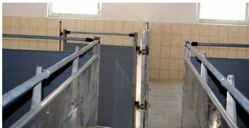
Chlewnia w OHZ w Garzynie

Przyjmując, według norm europejskich, przy utrzymywaniu na ruszcie potrzeba minimum 0,8 m 2 na jedno zwierzę, czyli na 1.000 tuczniaków potrzeba 800 m 2 . - Średnia cena rusztu betonowego jest różna, u nas kosztuje 103 zł/m 2 . Ale są firmy małe, regionalne, które oferują ruszty po 75 zł za m 2 . My co prawda robimy to w technologii, która w Polsce nie była dotąd stosowana, czyli technologii suchego betonu. Taki ruszt jest wytrzymały, bez mikropęknięć, stąd takie różnice cenowe - wyjaśnia Jan Kaźmierski. Różnice widać także w przyrostach dobowych. Naukowcy stwierdzili, że tuczniaki z chowu na głębokiej ściółce latem rosły znacznie wolniej niż na rusztach. Jednak zimą