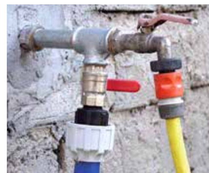
Podlewanie zależy wyłącznie od otwarcia zaworu