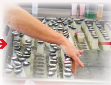
Kąpiel wodna w celu ogrzania mleka do temp. ok. 40°C