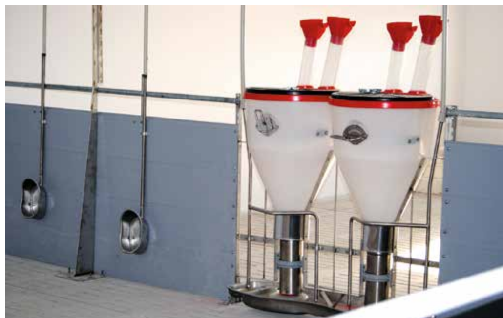
Chów na rusztach w chlewni OHZ w Garzynie

różnice w przyrostach nie były widoczne.