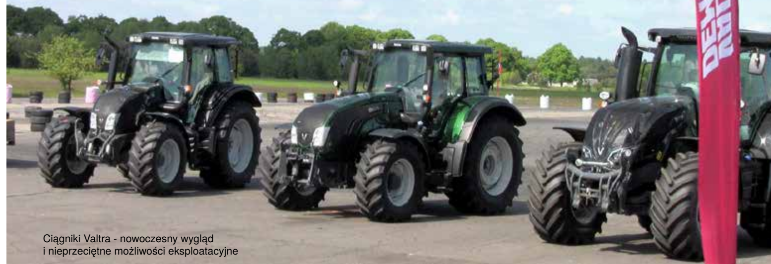
Ciągniki Valtra - nowoczesny wygląd i nieprzeciętne możliwości eksploatacyjne

Po przedstawieniu produktów uczestnicy pokazów przechodzili kolejno na cztery stanowiska, gdzie dowiadywali się między innymi, dlaczego warto kupić ciągnik Valtra, jakie rozwiązania techniczne spowodowały, że ciągniki te są