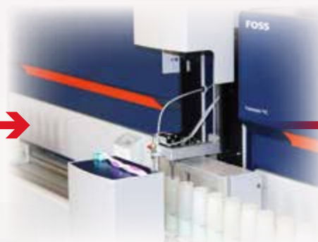
Próbka badana jest jednocześnie przez dwa aparaty