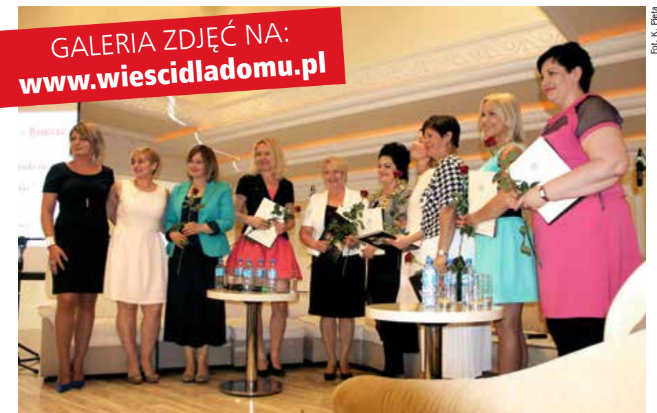
Kobiety z pasją - uczestniczki debaty