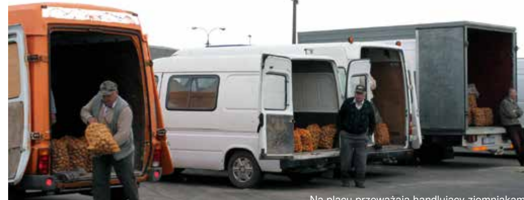
Na placu przeważają handlujący ziemniakami