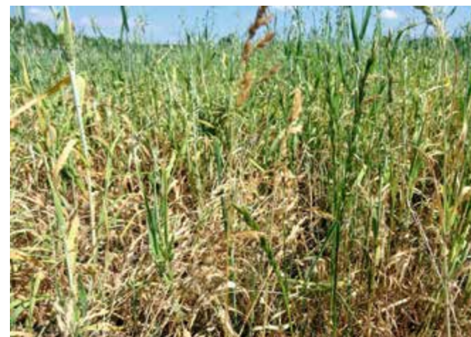
W gminie Turek susza najbardziej dotknęła zboża

Ekspertcy wskazują, że takiej suszy nie było co najmniej od